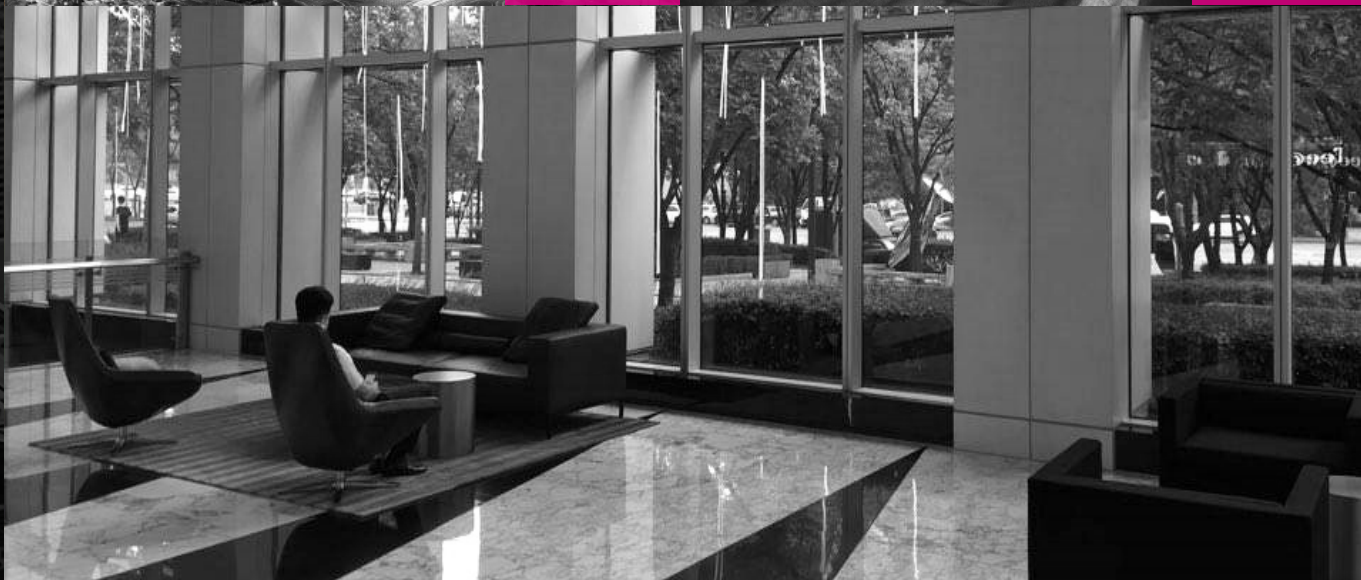
1층 로비 공간